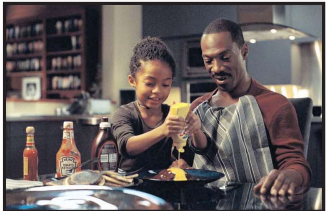
EDDIE MURPHY APRENDERÁ A SER MENOS EJECUTIVO Y MEJOR PADRE.

Comedia de moralina directa, critica a los tiempos modernos y reivindica la necesidad de querer a los hijos como se merecen. Busca y consigue la complicidad.