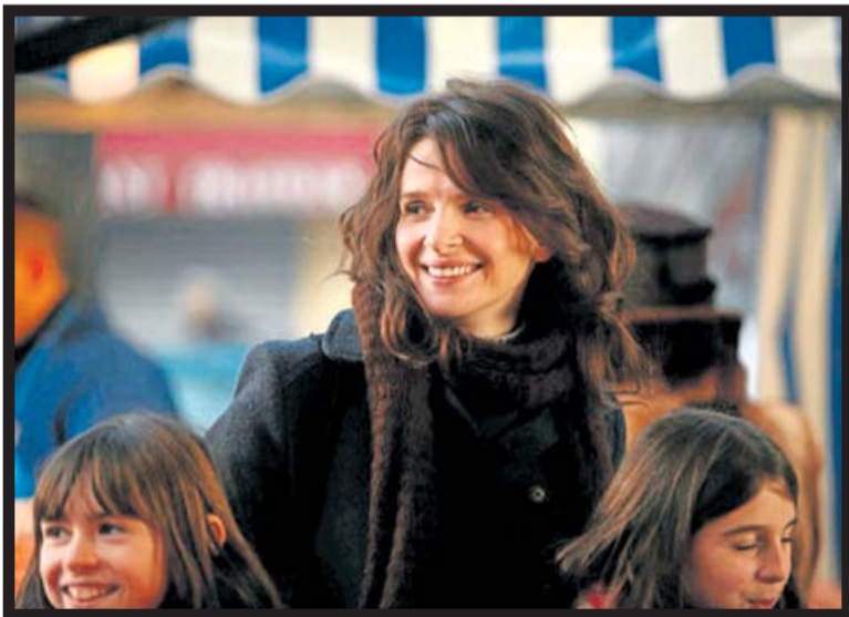
BINOCHÉ FORMA PARTE DEL CORAL Y COTIDIANO REPARTO DE 'PARÍS'.

Protagoniza G-Force un comando de animales “ultrainteligentes”, que trabajan para el gobierno ayudando a prevenir que el clásico y millonario malvado se apodere del mundo. Parodia no encubierta de los filmes de espionaje, el gran doblaje original lo firmaron Nicolas Cage, Penélope Cruz o Steve Buscemi.