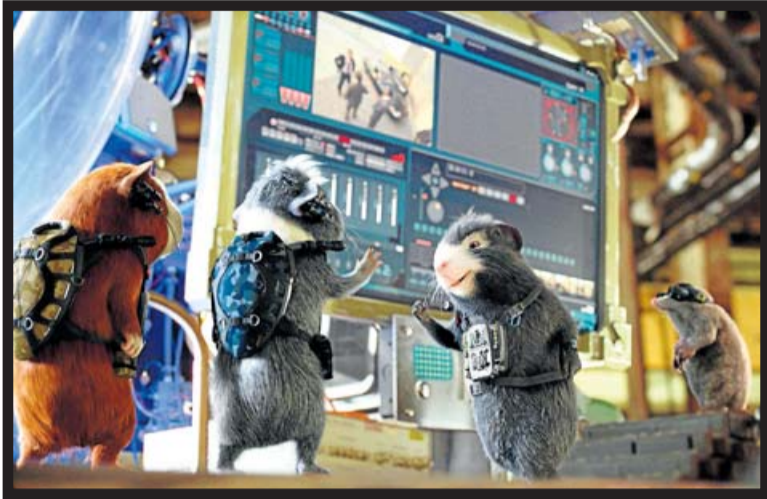
LA VERSIÓN ANIMAL DE JAMES BOND Y JASON BOURNE.