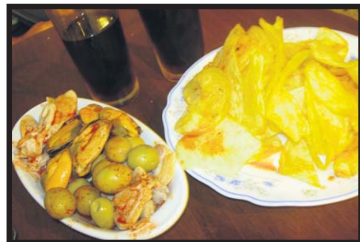
MEJILLONES Y CHIPS CON SALSA DE L'ÀVIA FRANCESCA.