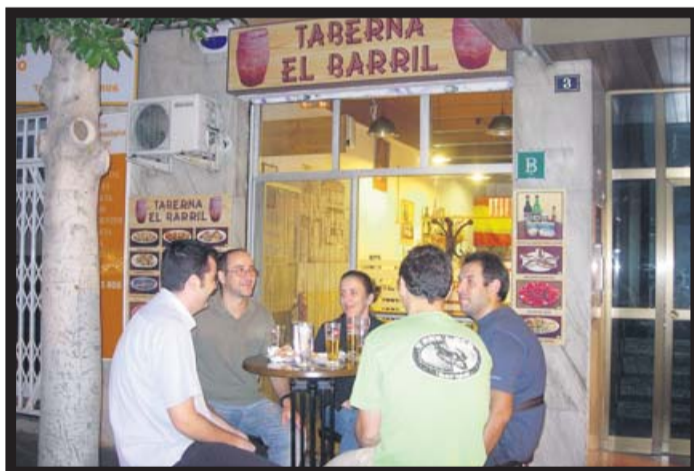
A FUERA HAY DOS MESAS PARA TOMAR EL VERMUT.

TABERNA EL BARRIL. TEL.: 645 999 315 C/ COMPTE DE BARCELONA, 3. PALMA ABIERTO DE LUNES A SÁBADO.