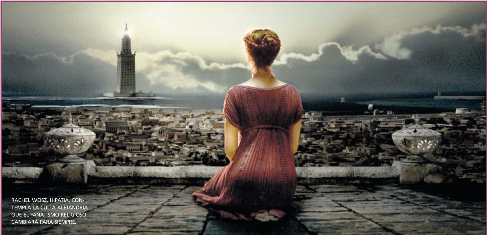
RACHEL WEISZ, HIPATIA, CON- TEMPLA LA CULTA ALEJANDRÍA QUE EL FANATISMO RELIGIOSO CAMBIARÁ PARA SIEMPRE.