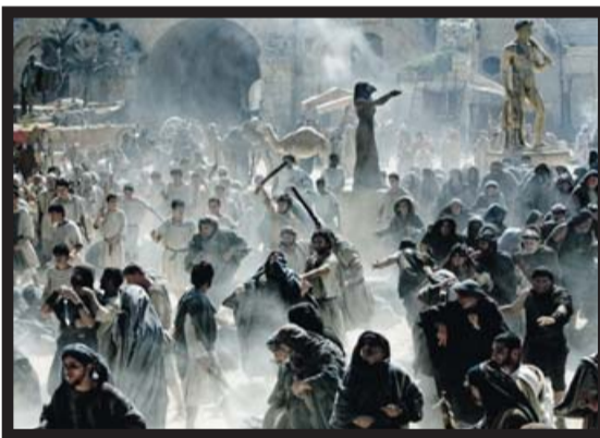
AMOR (OCULTO) DE ESCLAVO Y FUNDAMENTALISMO RELIGIOSO EN 'AGORA', LA CINTA ESPAÑOLA MÁS CARA.