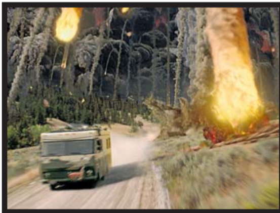
TERREMOTOS, TSUNAMIS, ERUPCIONES VOLCÁNICAS Y UN HOMBRE, CUSACK, QUE BUSCA SALVAR A LOS SUYOS.