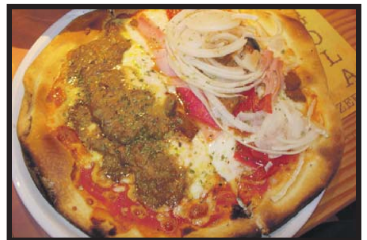
PODÉIS PEDIR MITAD DE UN SABOR Y MITAD DE OTRO.