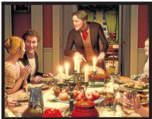
CLÁSICO PARA TODA LA FAMILIA.