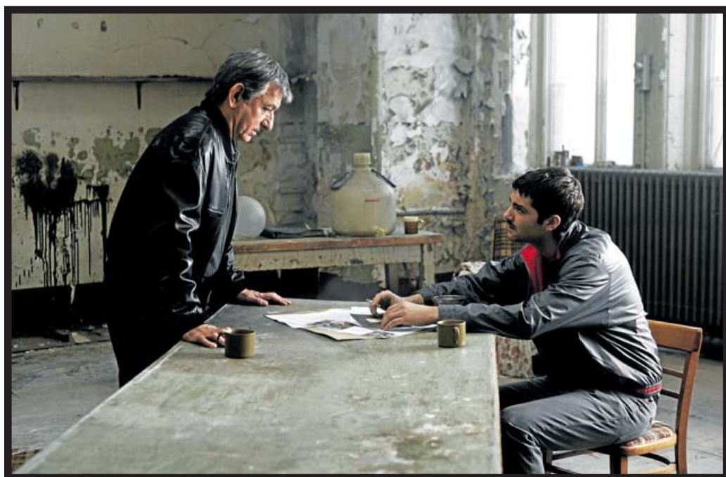
BEN KINGSLEY Y JIM STURGESS: POLICÍA Y DELINCUENTE DE Poca MONTA.

mos podido ver recientemente en Across the universe , interpreta al protagonista, un bandido de poca monta que trata de sobrevivir en el Belfast de finales de los 80. Por casualidad, es testigo de la brutal ejecución de un soldado, hecho que permite que Ferguson, un agente del MI5 (Ben Kingsley), le convenza para que trabaje como informador para los británicos. A partir de ese momento, Martin vivirá en una situación de constante peligro, bajo la amenaza de ser descubierto... y, es previsible, lo descubren. Así que, abandonado por quienes un día lo protegieron, parece que su vida está abogada a una muerte segura.